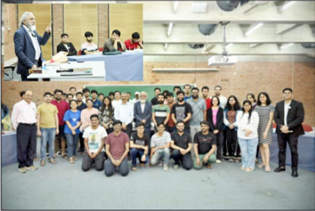
કેપી સુપના ચેરમેન અને એમડી ડો. ફારુક પટેલે આઈઆઈએમ અમદાવાદમાં લેક્ચર આપી વિદ્યાર્થીઓને બિઝનેસમેન મૂલ્યોના પાઠ ભણાવ્યા હતા.