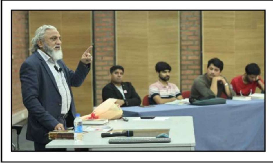
લેક્ચર વખતની તસ્વીર